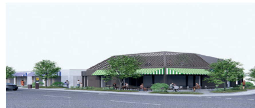
Illustration Krabbe - Vang