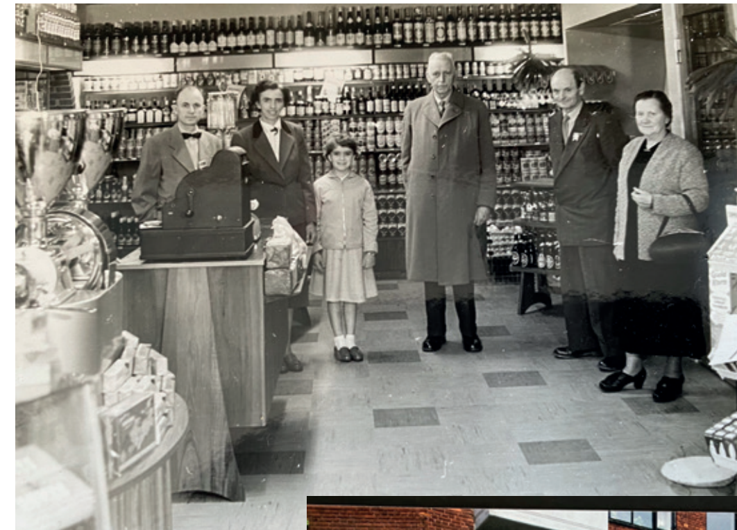
Foto fra butikken Bemærk bl.a. teaktræsgavlen på disken, inspireret af Eiffeltårnet Personerne er fra venstre forfatterens far, mor, lillesøster, morfar, farfar og farmor.

Og Nordre Strandvej er langt fra det eneste i Risskov, der har ændret sig siden 50'erne. Lad mig afslutningsvist komme med et par oplysninger, der virker næsten absurde set med nutidens briller: Renovation foregik dengang med hestevogn, og en étværelses lejlighed med køkken og bad samt altan kunne lejes for under 100 kroner om måneden. Og så fik du endda havudsigt med i prisen.