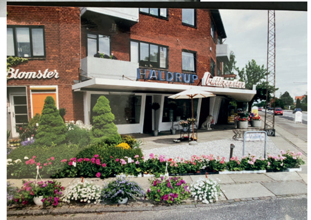
Foto af facaden Som de fleste Risskovborgere husker ejendommen i tiden før, den undergik en større renowering i 2016/2017