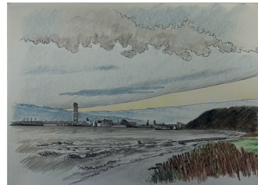
Illustration Steen Djervad, Risskov

I skrivelserne gør vi opmærksomt på en række uhenigtsmæssigheder, herunder at byens borgmester også er formand for Aarhus Havn.