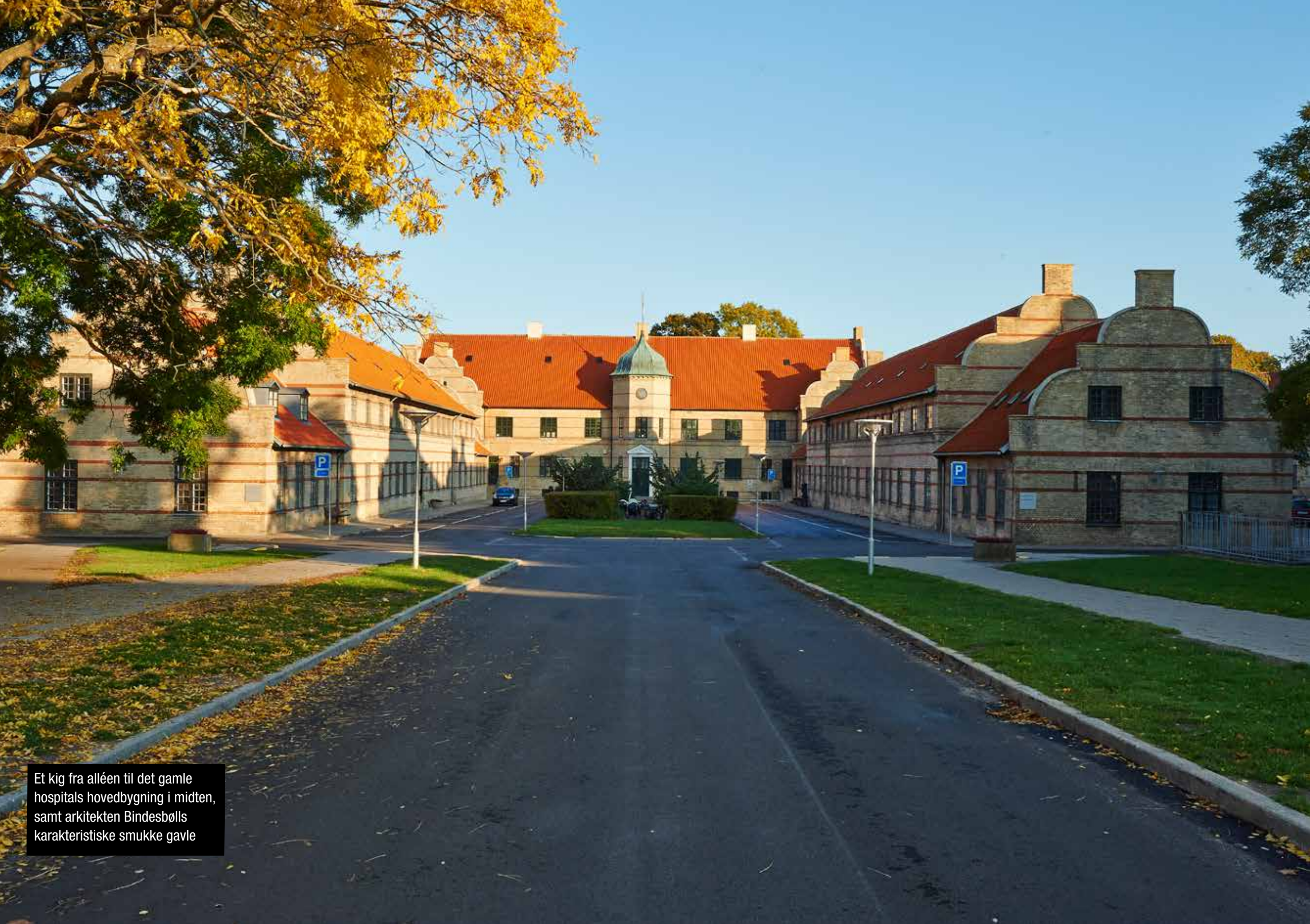
Et kig fra alléen til det gamle hospitals hovedbygning i midten, samt arkitekten Bindsbølls karakteristiske smukke gavle