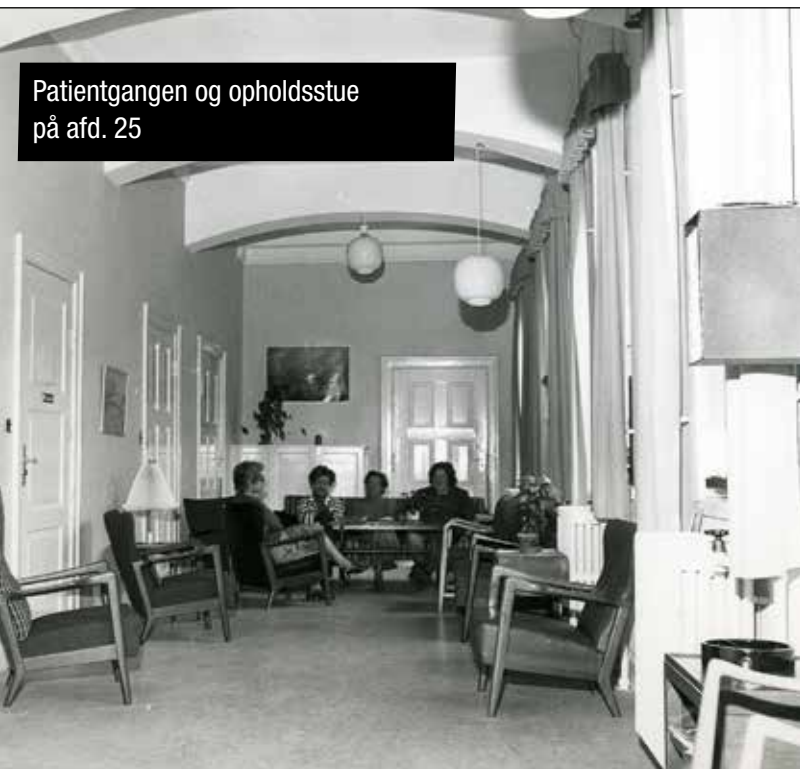
Patientgangen og opholdsstue på afd. 25