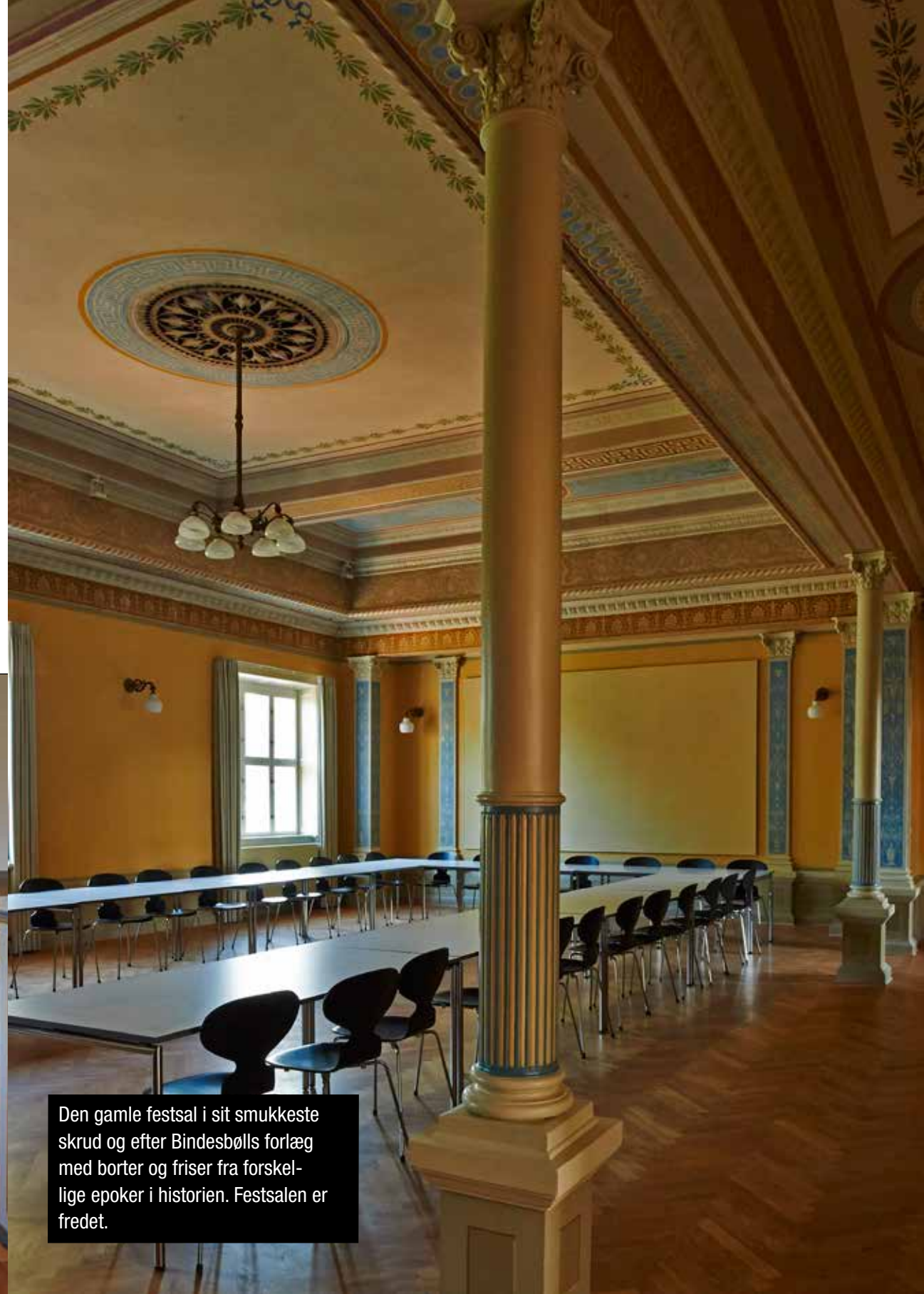
Den gamle festsal i sit smukkeste skrud og efter Bindsbølls forlæg med borter og friser fra forskellige epoker i historien. Festsalen er fredet.