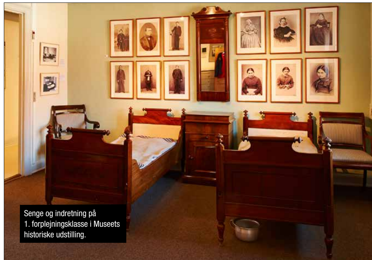
Senge og indretning på 1. forplejningsklasse i Museets historiske udstilling.

Betalingen var følgelig forskellig for de tre klasser. 1. og 2. klasse betalte mere end nødvendigt, henholdsvis cirka 2 kroner og 1 krone pr. dag, så at man for de mindrebemidlede på 3. klasse kunne give rabat og komme ned på 50 øre.