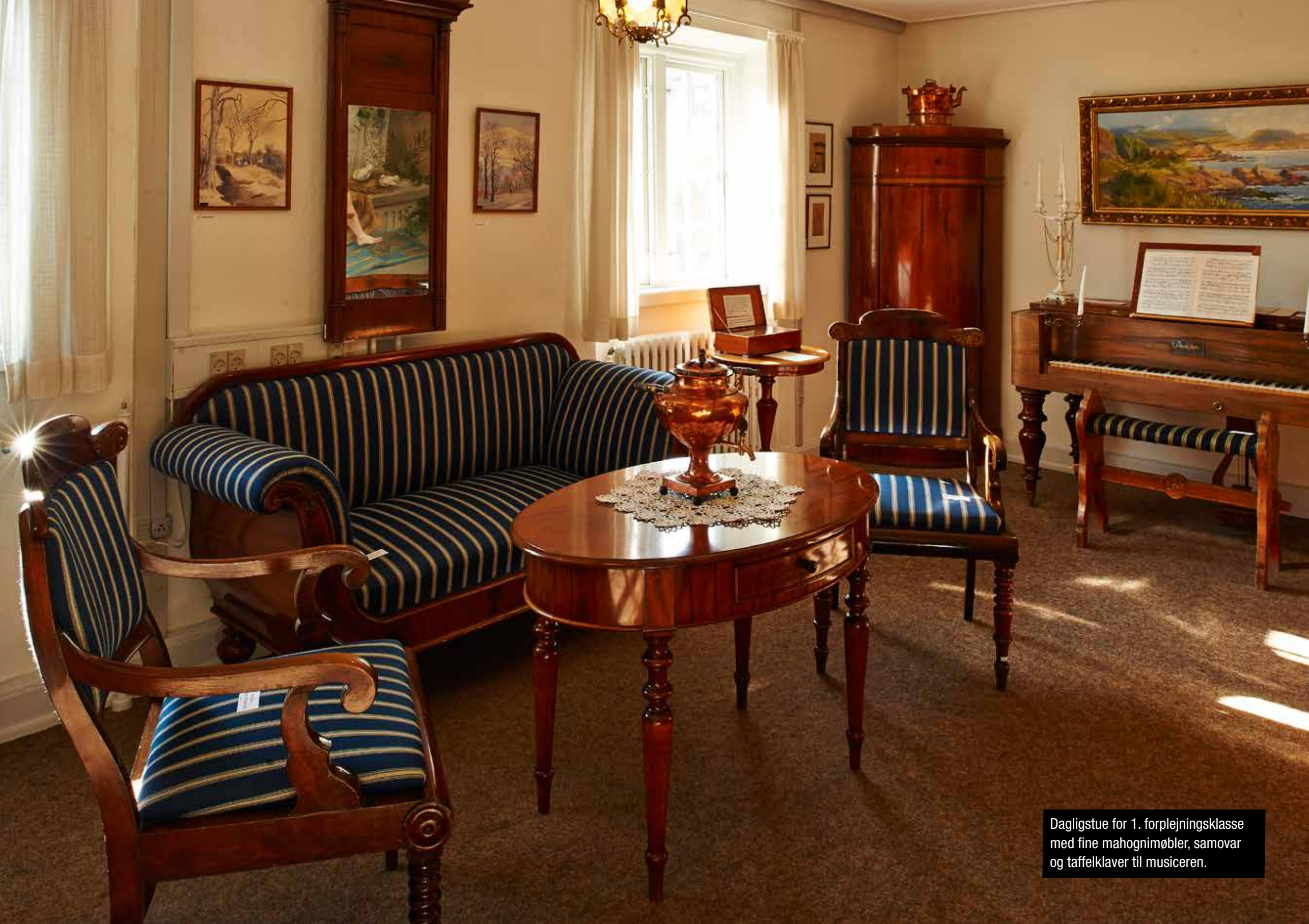
Dagligstue for 1. forplejningsklasse med fine mahognimøbler, samovar og taffelklaver til musiceren.